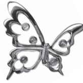
蝶<金>：99,000円 <銀>：93,500円 (ファンシーカラーサファイア)