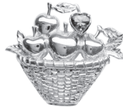
リンゴ：110,000 円 (ピンクトルマリン)