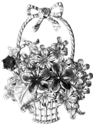
すみれ(堇)：151,800円 (アイオライト) (イエローサファイア)