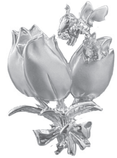
Blue Bee (青蜂)：154,000円 (アクアマリン) (女神のスターダイヤモンド)