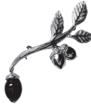
どんぐり：104,500円 (シリマナイトキャッツアイ)