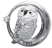
ふくろう：110,000 円 (クリソベリルキャッツアイ)

素材：925シルバー（針：洋白 風車：K14WG） 24金メッキ 黒猫：ブラックロジウムメッキ/ふくろう：アクリル樹脂 蕨 2 輪：純銀に東京七宝