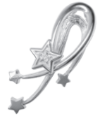
流れ星：121,000 円～ (女神のスターダイヤモンド)