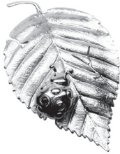
てんとう虫：115,500 円 てんとう虫のみ：61,600 円 (ルビー)

マダムイマダがお届けする幸福の扉を開く夢のアクセサリーは、ヴェルメイユという技法で製作しています。純銀に純金をかぶせたヴェルメイユはフランス王ルイ 14 世が祝祭の食卓に自分一人だけのヴェルメイユの食器、カトラリーを使用したと伝えられる特別高価なもので「金箔を着せた純銀」とも言われています。沢山の幸せが皆様の元へ訪れますように。