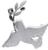
鳩：88,000円 (グリーンサファイア)