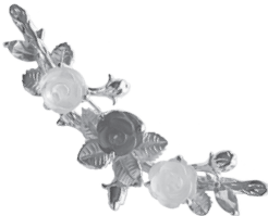
薔薇：126,500 円 (ローズクォーツ) (カーネリアン) (ロククリスタル)