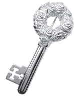
鍵：84,700 円 (ピンクサファイア)