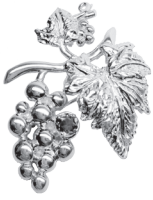
ぶどう：110,000円 (アメシスト)