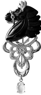
馬：154,000円 (ブラックカルセドニー) (ムーンストーン)