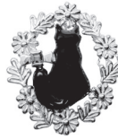
黒猫：77,000 円 (ルビー)