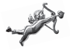
キューピット：84,700 円 (ルビー)