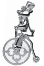
ぶた：115,500円 (マザーオブパール)